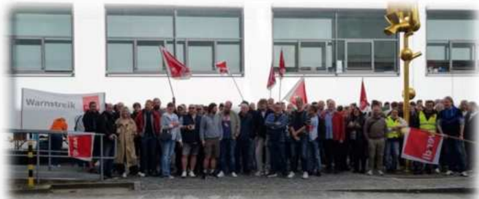
München, Foto: ver.di