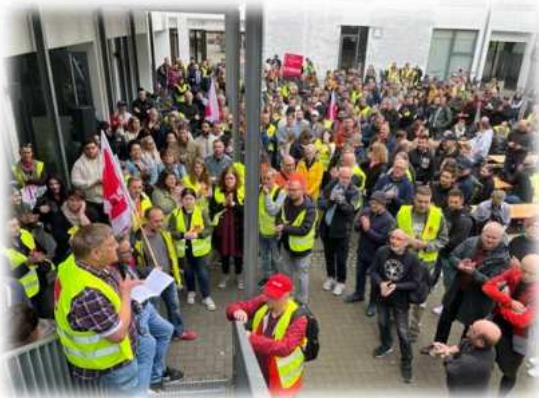
Hannover, Foto: ver.di