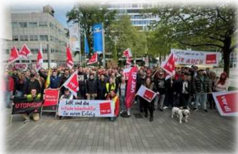
Bielefeld, Foto: ver.di