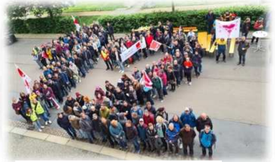
Dresden, Foto: Daniela Grosser