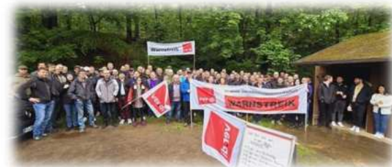
Kassel, Foto: ver.di