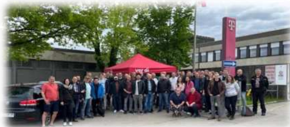
Augsburg, Foto: ver.di