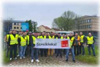
Stralsund, Foto: ver.di