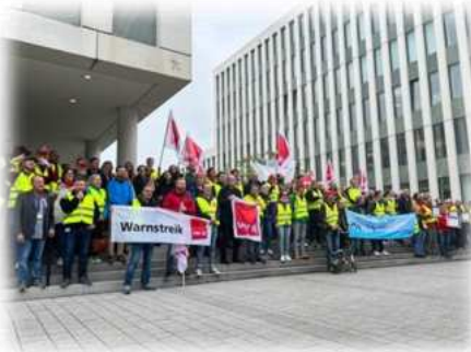
Bonn, Foto: ver.di